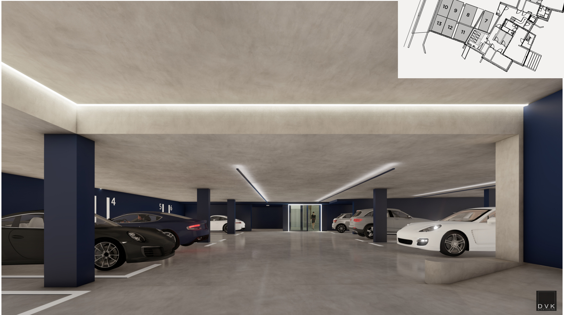
Place de parking N°6