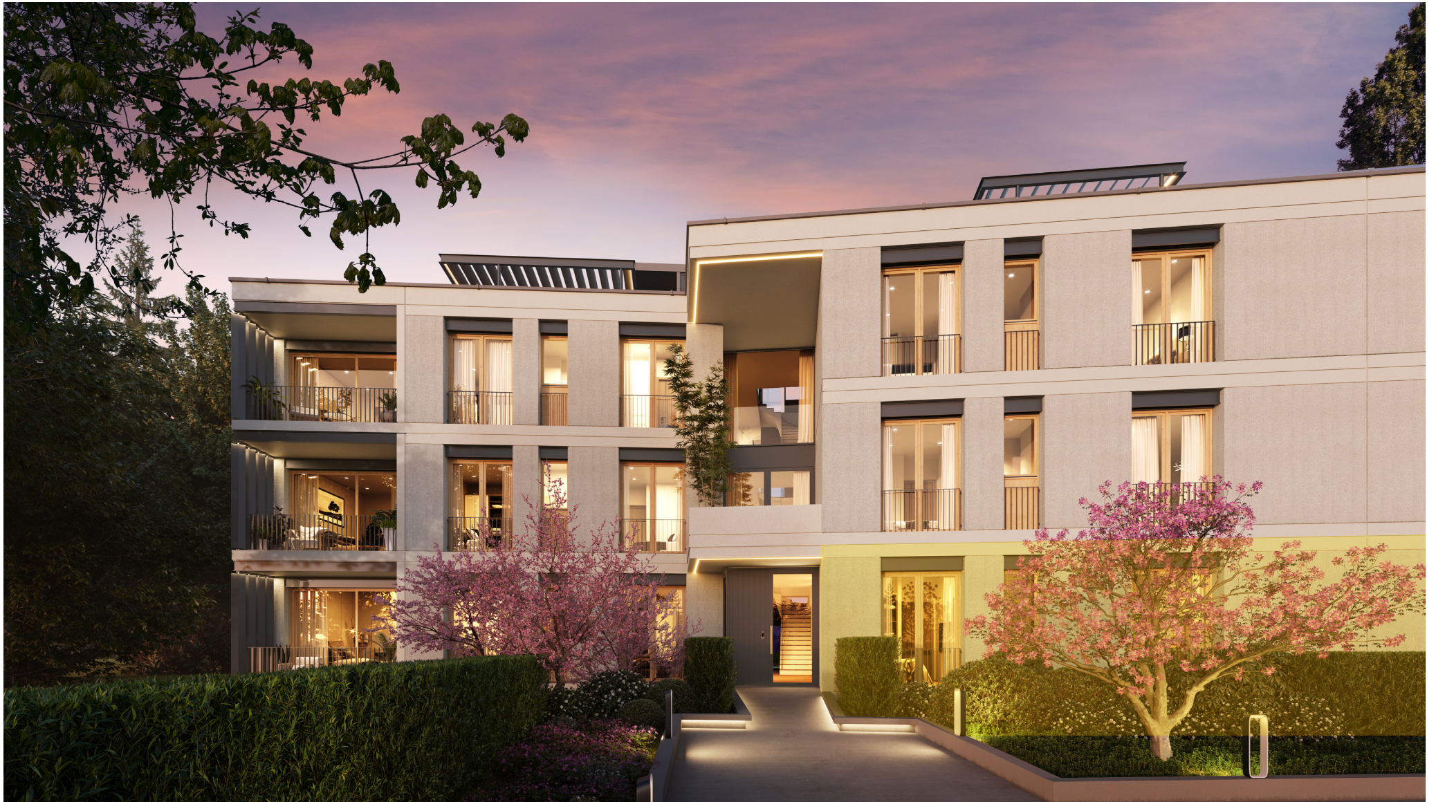
Lot A - Duplex